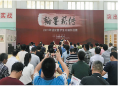
活动现场,由诏安教育书画研究会聘请专家,经过认真、公平、公正地评选,共评出100幅优秀作品进行展出。

儿童画等画种,由诏安教育书画研究会聘请专家,经过认真、公平、公正地评选,共评出100幅优秀作品进行展出。